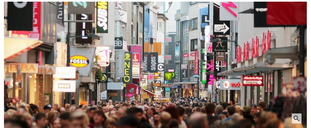
Deutsche Shoppingödnis: Die Fußgängerzone Hohe Straße in der Innenstadt von Köln